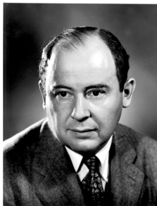
Slika 2: John von Neumann

Prav leta 1947 je von Neumann napisal izrek o krepki dualnosti, ki nam ob predpostavki, da obstaja optimalna rešitev začetnega problema, zagotavlja obstoj optimalne rešitve dualnega problema in trdi, da sta optimalni vrednosti obeh problemov enaki. Kasneje je von Neumann Dantzigu predlagal iterativno nelinearno reševanje.